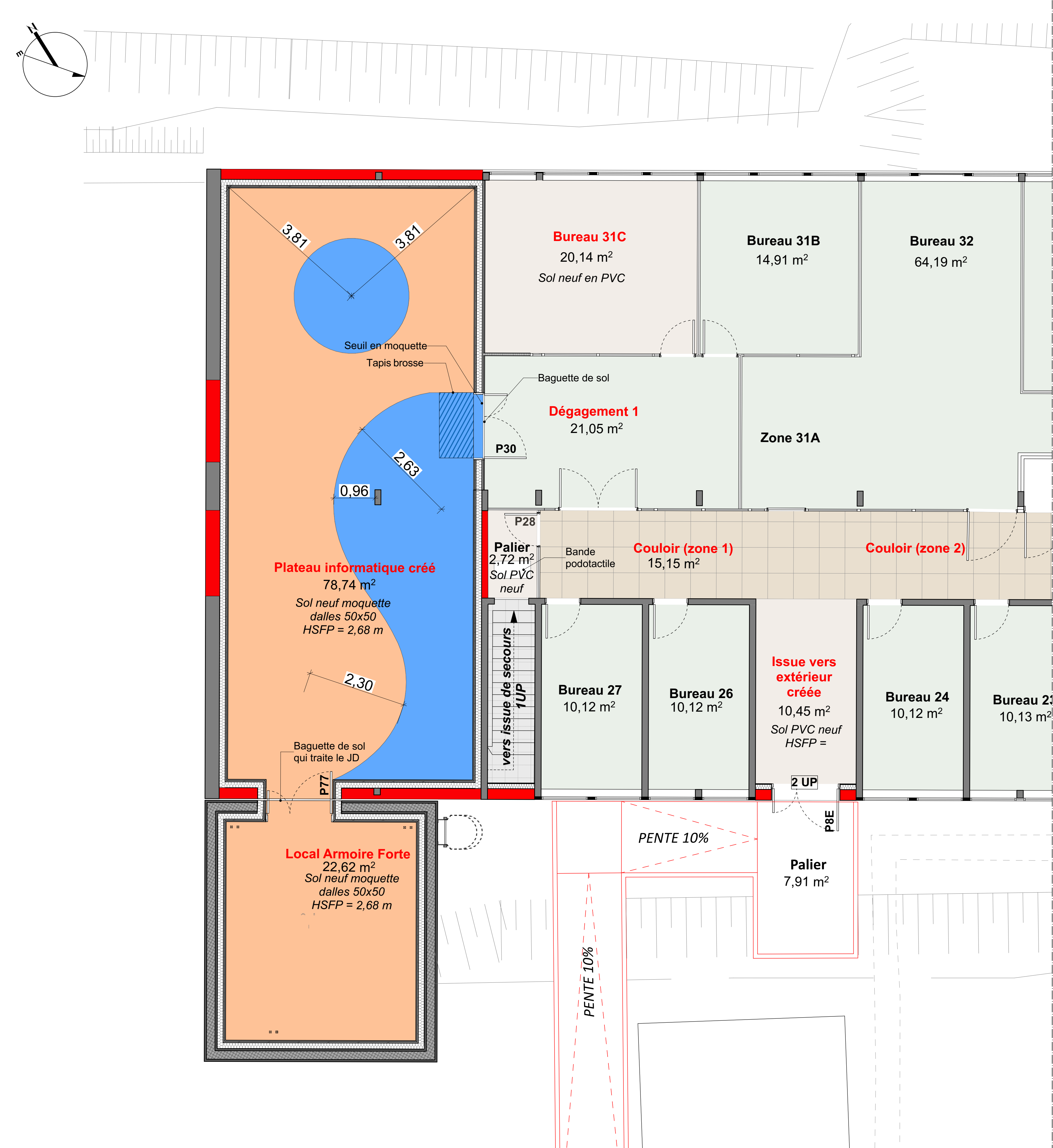
PLAN DE CALEPINAGE SOL SOUPLE